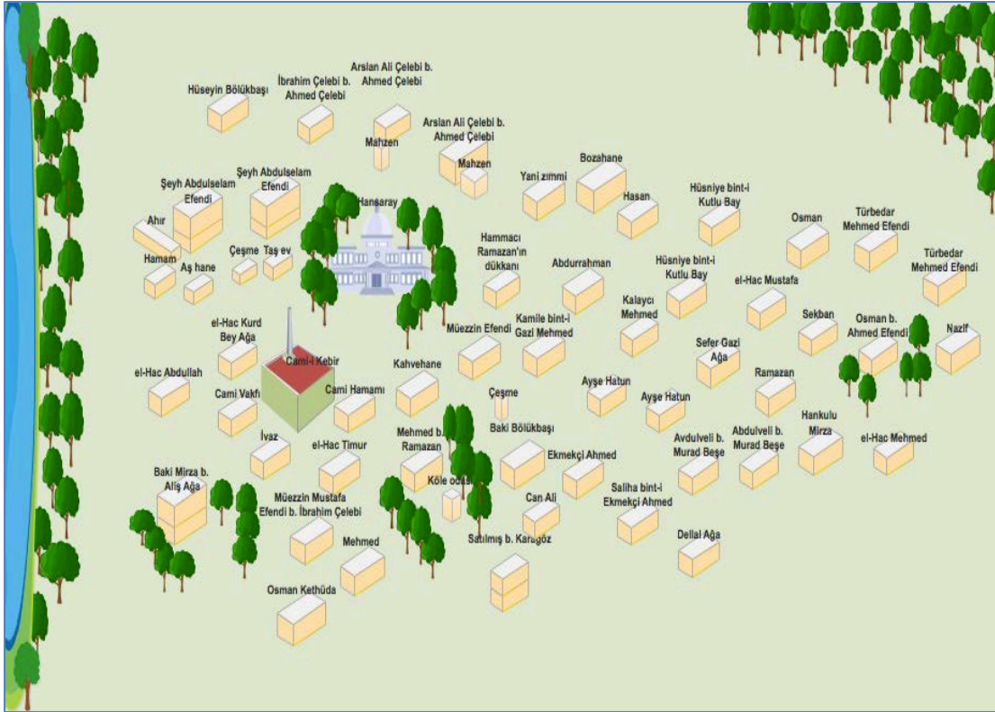
Görsel 1 Cami-i Kebir Mahallesi

Cami-i Kebir Mahallesi'nin Bahçesaray şehrinin en büyük iki mahallesinden biri olduğunu belirtmiştik. Mahallenin büyüklüğü sadece mekânsal açıdan bir büyüklük değil aynı zamanda şehir nüfusunun yoğunlaştığı yerlerden biri olmasından dolayıdır. Nüfusun fazla olduğu yerlerde kişilerarası münasebetler artmakta; gayrimenkul alım satımı,