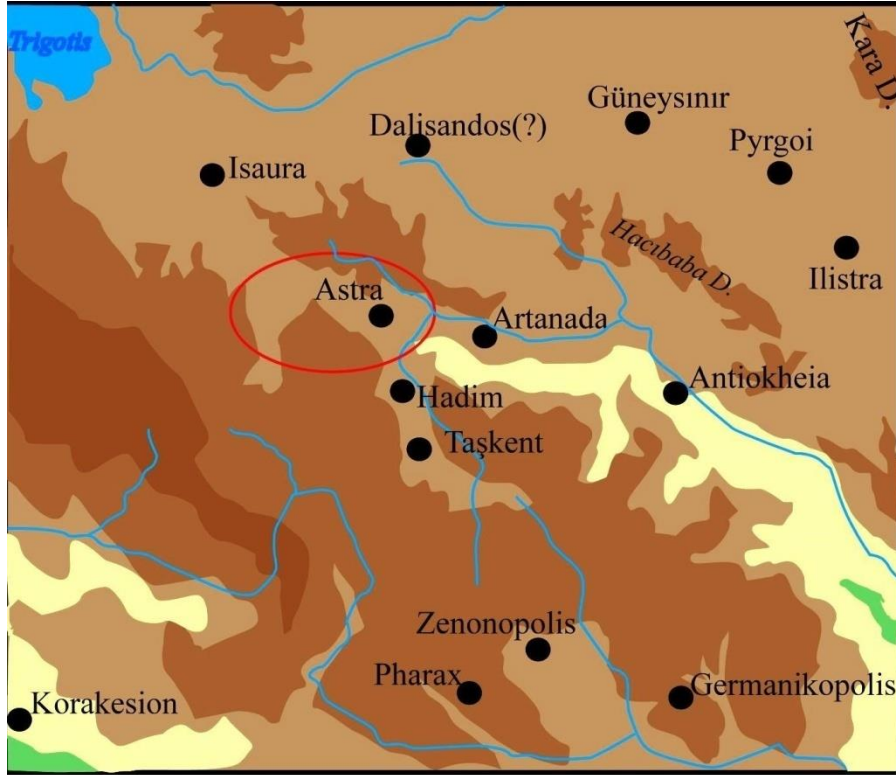
EK 1. Astra ve yakın çevre haritası